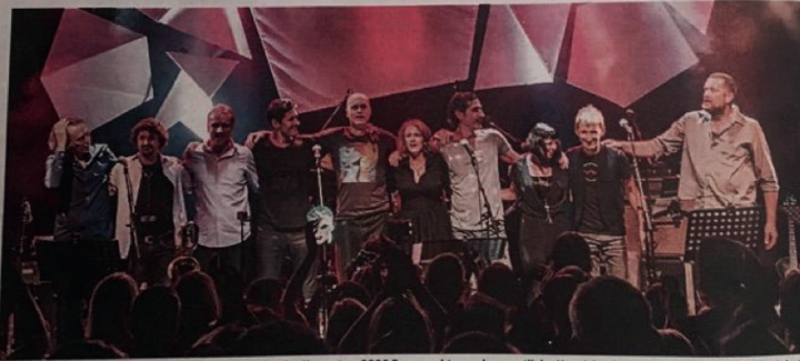
Sie rockten die Generalmusikdirektion: Der Reinerlös des Konzerts – 8000 Euro – geht ans ehrenamtliche Hospizbegleiter-Team der Mobilien Palliativbetreuer

mit „Heroes“, in das Sänger und Publikum einstimmen. Die Reaktionen auf den sozialen Netzwerken zum Konzert waren euphorisch: Eine Wiederholung steht deshalb ebenso im Raum wie ein Konzert in Wien. Reinerlös des Abends: 8000 Euro.